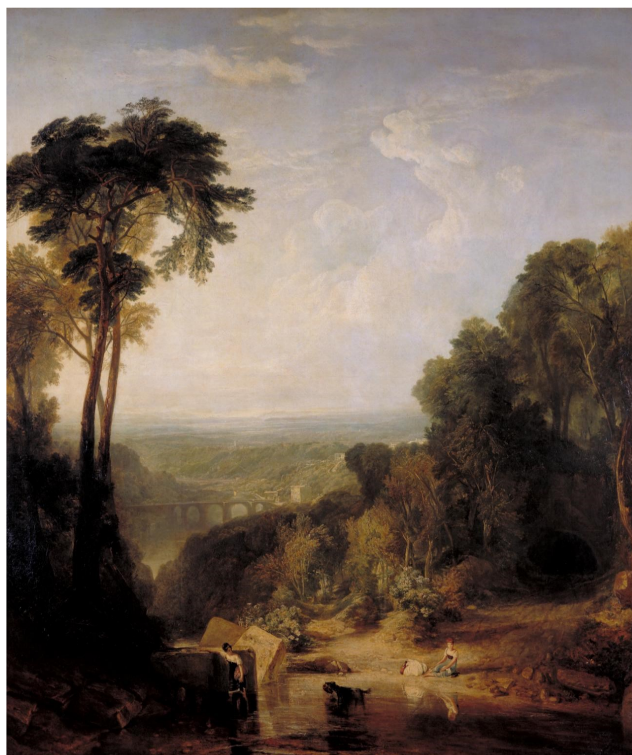
C.M.W. Turner, La Traversée du ruisseau, 1815