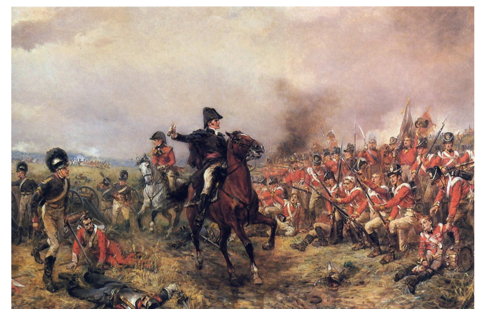
R.A. Hillingford, Wellington in Waterloo, 1815